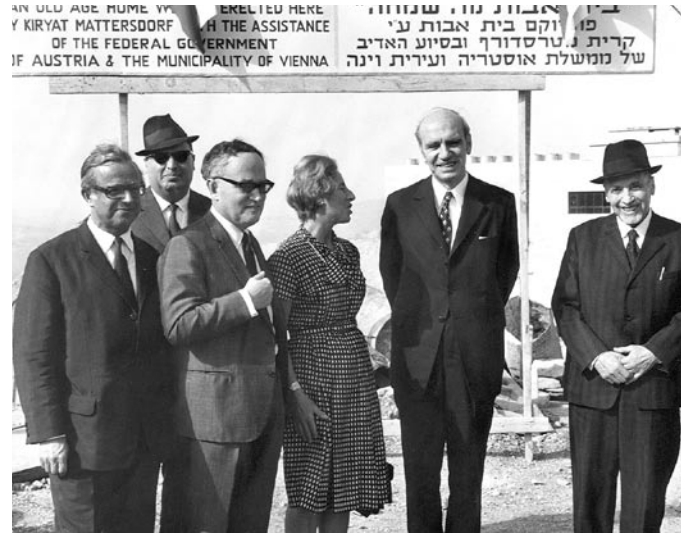
In Israel angekommen: Als erster Außenminister besuchte Rudolf Kirchschläger (2.v.r.) 1972 Israel – für Rolf Steininger der Höhepunkt der Beziehungen zwischen den zwei Staaten

„Diese Zeit war sehr schwierig. Deutsch war in Israel kein Thema, selbst die Wiener Sängerknaben durften nicht auftreten“, erklärt Steininger. Zudem kommt, dass das offizielle Israel Österreichs Opferthese akzeptiert, die Medien aber, teilweise von Vertriebenen geleitet, sich nicht auf diesen Kurs einlassen. „Von dieser Seite kamen die kritischen Kommentare, die Presse war quasi die Opposition.“ 1959 wird Ernst Luegmayer der erste Botschafter in Israel, zwei Jahre später hält er fest, dass man von der Opferthese Abstand nehmen sollte, die nehme Österreich sowieso niemand ab. Mit ins Bild passt, dass kein österreichischer Außenminister, von Karl Gruber über Bruno Kreisky bis zu Kurt Waldheim, trotz zahlreicher Einladungen nach Israel kommt. 1967 beginnt der Sechstageskrieg, Österreich ist in Israel kein Thema mehr. 1972 reist mit Rudolf Kirchschläger der erste österreichische Außenminister nach Israel, für Steininger der Höhepunkt der