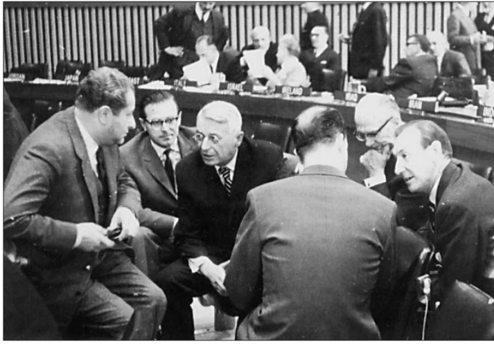
Ein historisches Bilddokument: Bruno Kreisky (links), Franz Gschnitzer (Mitte) und Kurt Waldheim (rechts) im Oktober 1960 vor der UNO.