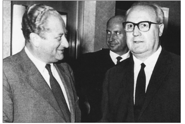
Österreichs Außenminister Bruno Kreisky mit seinem italienischen Amtskollegen Giuseppe Saragat in Genf am 25. Mai 1964.