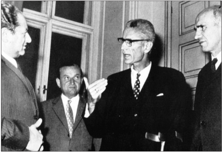
Bruno Kreisky (links) im Gespräch mit Landeshauptmann Silvius Magnago; mit im Bild auch Fred Sinowatz und Rudolf Kirchschläger (rechts).